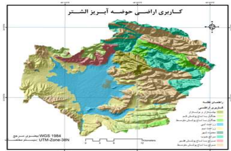
شکل ۳: وضعیت کاربری اراضی در سطح حوضه آبریز الشتر

از آنجا که در پژوهش حاضر بررسی وضعیت فرسایش حوضه و ارتباط آن با وضعیت آینده توسعه کشاورزی و، به تبع آن، توسعه سکونتگاه‌های روستایی حوضه آبریز الشتر ملاحظه شده است، پس از پهنه‌بندی فرسایش در سطح حوضه و تعیین کلاس‌های فرسایش با هم‌پوشانی لایه‌ی نقاط روستایی و شهری محدوددهی حوضه و انطباق کلاس‌های فرسایش با وضعیت موجود کاربری اراضی شرایط هرکدام از کاربری‌ها (جدول ۴) در سطح حوضه بررسی شد و نتایج ذیل به دست آمد: از مجموع ۲۰۸ نقطه‌ی روستایی در سطح حوضه، ۲۵ نقطه (معادل ۱۲/۰۱) درصد از نقاط روستایی در کلاس فرسایش IV و V، ۸۴ نقطه (معادل ۴۰/۳۸ درصد) در کلاس فرسایش II، ۹۸ نقطه (معادل ۴۷/۱۱ درصد) در کلاس فرسایش I، و سرانجام، ۱ نقطه (معادل ۰/۴۸ درصد) در کلاس فرسایش III قرار گرفته‌اند. به عبارت دیگر، ۸۸/۷۶ درصد نقاط روستایی در وضعیت مناسبی به لحاظ فرسایش هستند.