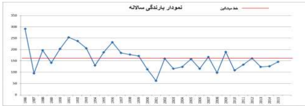
شکل ۴: تفکیک دو دوره مرطوب و خشک در بررسی سی ساله

شکل ۵، طبقات بارش سالانه در سری زمانی سی ساله محدوده مطالعه را بر اساس شاخص استاندارد بارش (SPI) نشان می‌دهد. ترسالی و خشکسالی با شدت‌های مختلف همچنین تغییرات بارندگی سالانه در سال‌های نرمال رخدادهایی هستند که در این نمودار ارائه گردیده‌اند.