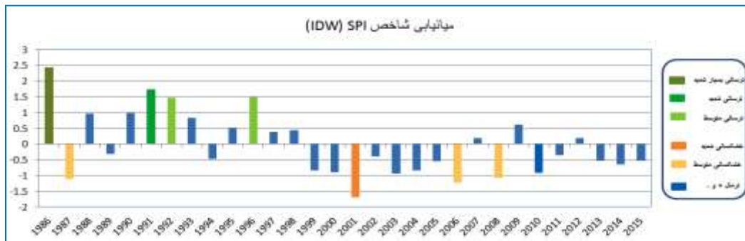
شکل ۵: مقایسه شاخص استاندارد بارش (SPI) و شدت رخدادها در محدوده مطالعه بر اساس میانمایی (IDW)

شکل ۵، طبقات بارش سالانه در سری زمانی سی ساله محدوده مطالعه را بر اساس شاخص استاندارد بارش (SPI) نشان می‌دهد. ترسالی و خشکسالی با شدت‌های مختلف همچنین تغییرات بارندگی سالانه در سال‌های نرمال رخدادهایی هستند که در این نمودار ارائه گردیده‌اند.