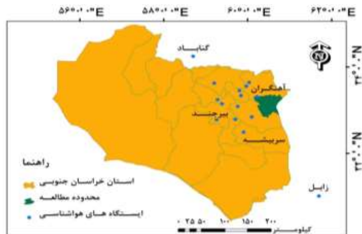
شکل ۲: موقعیت ایستگاه های هواشناسی محدوده مطالعه

با استفاده از داده‌های بارش روزانه ۱۵ ایستگاه هواشناسی در اطراف محدوده مطالعه (شکل ۲)، بارندگی سالانه در طول دوره سی ساله (۱۹۸۶-۲۰۱۵ میلادی) استخراج گردید سپس این داده‌ها برای محدوده مطالعه به روش IDW ۱ در نرم‌افزار ArcGIS میانمایی و با استفاده از شاخص استاندارد بارش (SPI ۲ ) سال‌های خشک، تر و نرمال مشخص شدند. برای تکمیل سال‌های فاقد داده بارندگی هریستگاه از روابط همبستگی با ایستگاه‌های مجاور و نرم‌افزار SPSS استفاده شد.