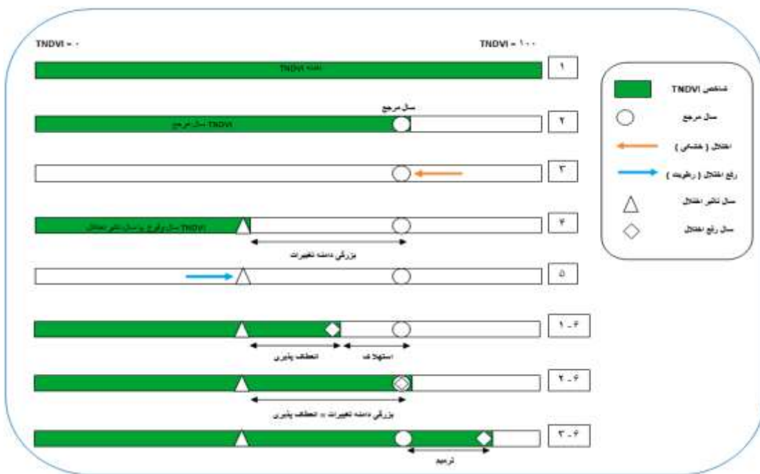
شکل ۳: چارت مفهومی کمی‌سازی عواملی بازگشت‌پذیری و مفاهیم اصلاحی

برای محاسبه عوامل انعطاف‌پذیری، استهلاک و ترمیم در هر رخداد آشفتگی، سه سال برای مقایسه لازم است که شامل سال مرجع، سال تاثیر رخداد و یک سال یا میانگین چند سال پس از رفع رخداد است (Washington-Allen et ۲۰۰۸). مفهوم عوامل مورد بررسی و نظرات اصلاحی در شکل ۳، به صورت چارت مفهومی ارائه گردیده است.