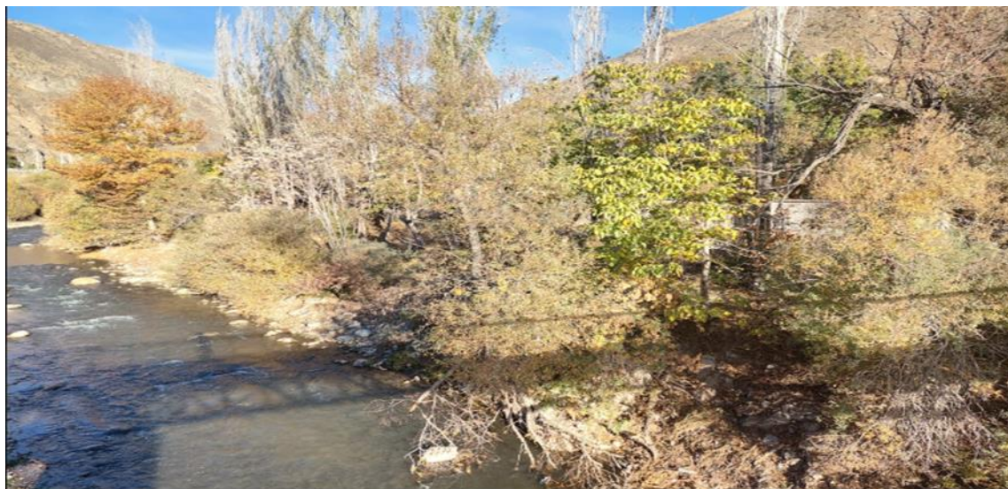
شکل ۳. محافظت سطحی کرانه توسط پوشش گیاهی و ریشه درختان