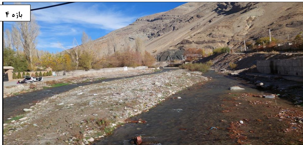
شکل ۴. پلانفرم شریانی رودخانه جاجرود، از زربند تا امین آباد (بازه ۱) و کلیگون تا اوشان (بازه ۴)