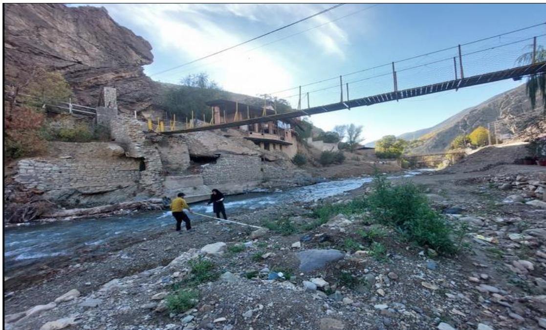
شکل ۶. تصویری از بازه فرسایش پذیری در کناره چپ و رسوبگذار در کناره راست رودخانه جاجرود از رودک تا کلیگون (بازه ۳)