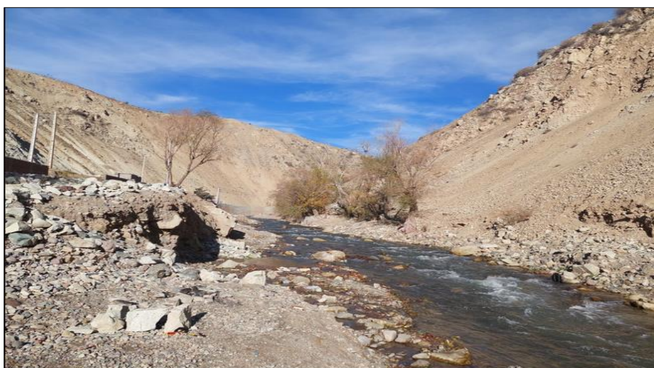
شکل ۵. تصویری از بازه فرسایش پذیر رودخانه جاجرود، از امین آباد تا رودک (بازه ۲)