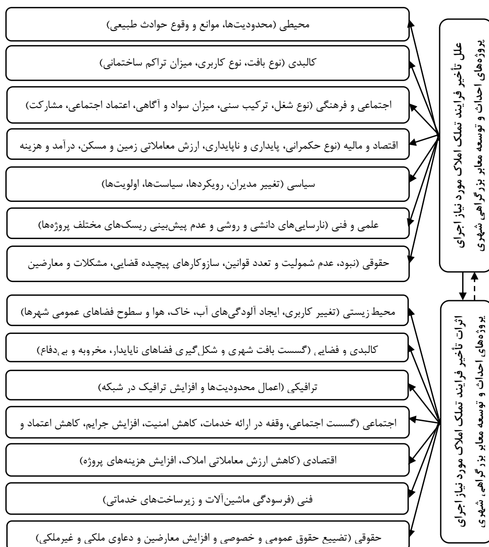
شکل ۱. مدل مفهومی (علل و تأثیر تأخیر فرایند تملک املاک و اجرای پروژه‌های احداث و توسعه بزرگراه‌های شهری)

۳. اثرات ترافیکی و حمل‌ونقلی: تأخیر مستمر و زیاد در فرایند تملک املاک مورد نیاز پروژه‌های احداث و توسعه بزرگراه‌ها و سایر جاده‌های شهری، اعمال محدودیت‌های مدیریتی و فیزیکی (بسته شدن و ایجاد مسیرهای انحرافی) و افزایش ترافیک سواره در معابر پیرامون آن پروژه‌ها را موجب می‌شود.