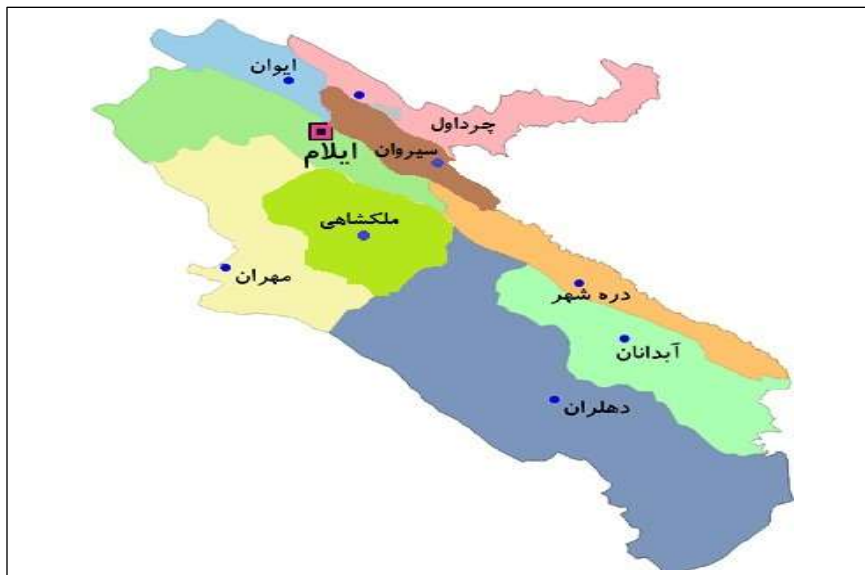
شکل ۲: موقعیت جغرافیای شهرستان دهلران در استان ایلام

شهرستان دهلران در جنوب ایلام و در فاصله ۹۱۰ کیلومتری تهران واقع شده است. دهلران آب و هوای بیابانی و نیمه بیابانی «گرم و خشک» دارد. این شهرستان در جنوب شرقی استان ایلام و جنوب غربی دینار کوه و در فاصله ۲۲۸ کیلومتری ایلام و ۱۰۰ کیلومتری شهرستان اندیمشک واقع شده است. این شهر که در دامنه جنوب و جنوب غربی دینار کوه قرار دارد. شکل ۲ موقعیت جغرافیای شهرستان دهلران در استان ایلام را نشان می دهد.