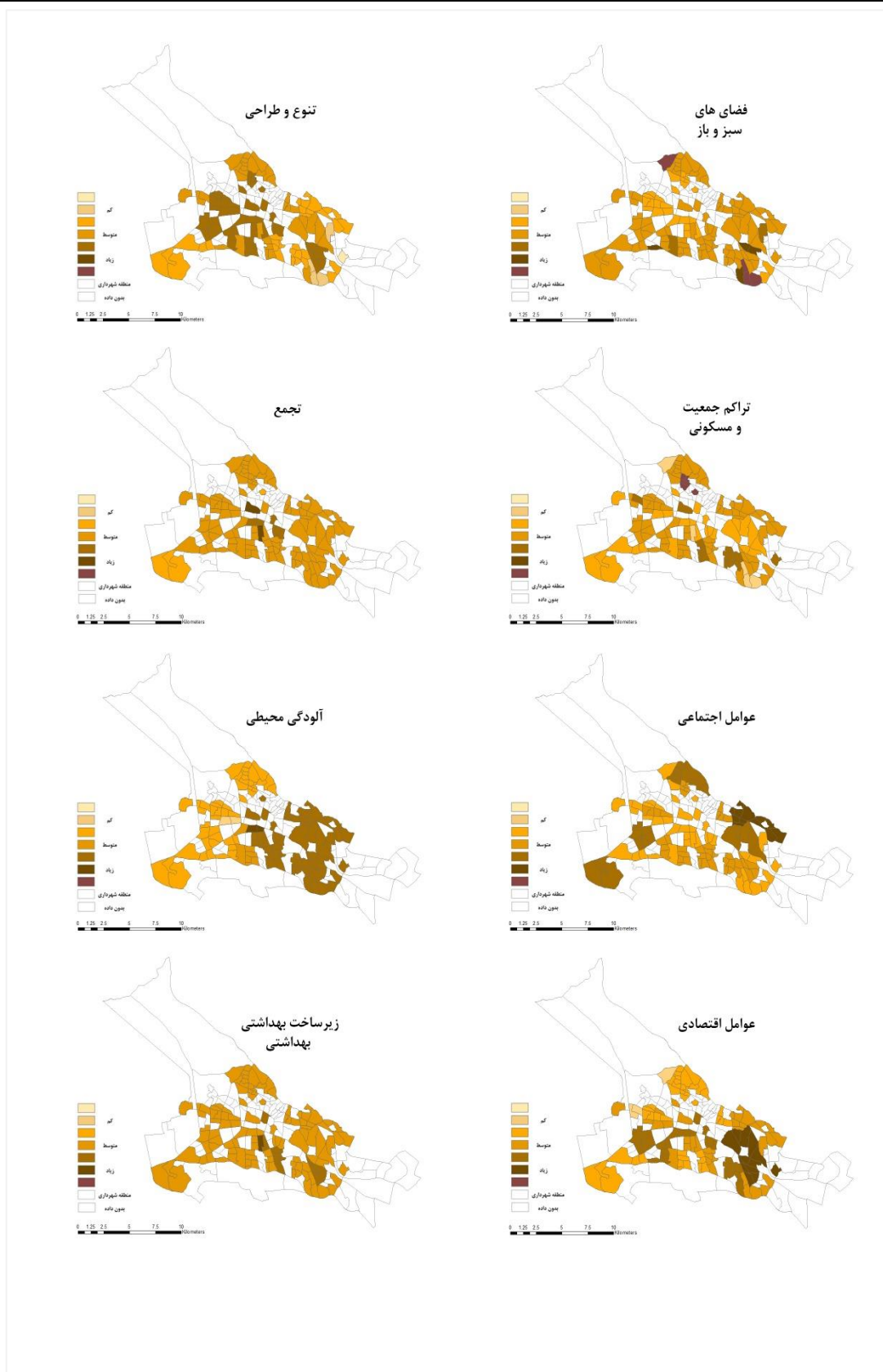
شکل ۳. توزیع فضایی مؤلفه‌های تاب‌آوری شهری در بحران اپیدمیولوژیک محلات کلان شهر تبریز