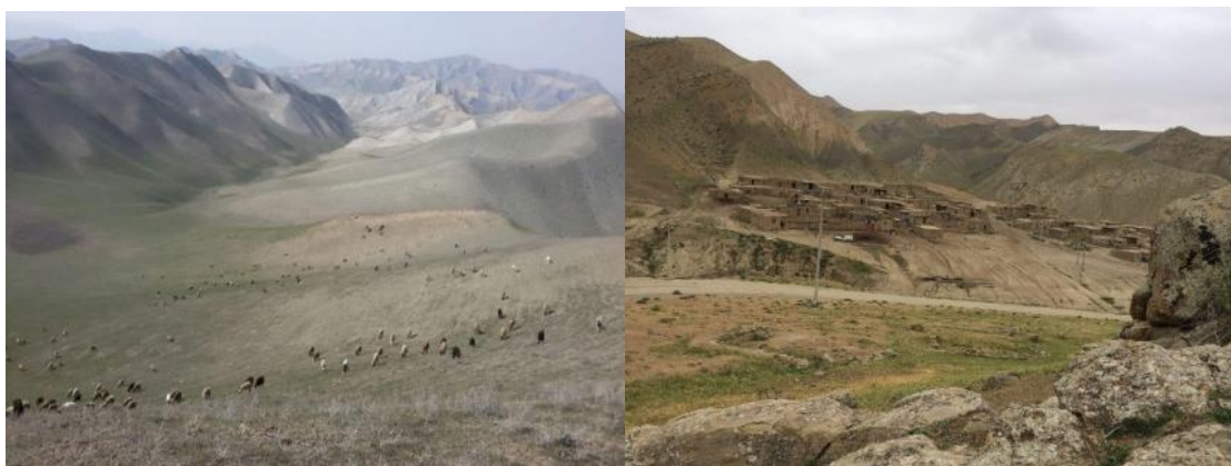
شکل ۲. آغل‌های منطقه قشلاقی چلاق کوچ نشینان دربندی

در نقشه زیر مراتع طایفه دربندی نشان داده شده است. مراتع زمستانی نیمه کوچ‌نشینان دربندی، در دامنه‌های شمالی ارتفاعات هزارمسجد و در مجاورت مرز کشور ترکمنستان (مابین روستای خشت و روستای ارچنگان در ناحیه‌ای در کنار پاسگاه دهچه) قرار داشته و مرتع قشلاقی چلاق نامیده می‌شود. نیمه کوچ‌نشینان دربندی در فصل زمستان برای گذران قشلاق خود به آن منطقه کوچ می‌کنند. دامداران دربندی از گذشته اتکای شدیدی به مرز و علف چرکردن ناحیه مرز ترکمنستان داشته‌اند. مطابق نقشه ارتفاع قشلاق چلاق که در محدوده مرز می‌باشد حدود ۶۰۰ تا ۷۰۰ متر با مساحت ۳۵/۳۸ کیلومتر مربع می‌باشد. قشلاق محدوده دهچه با مساحت آن ۴۳/۴۶ کیلومتر مربع است. دامداران تقریباً از اوایل پاییز و یا حتی اواخر تابستان در بعضی از مواقع شروع به کوچ به منطقه قشلاقی می‌کنند و تا اوایل خرداد نیز در آنجا ساکن هستند. بعد از کوچ دامداران، برای تجدید علوفه منطقه به صورت قرق درمی‌آید و تا اوایل پاییز سال بعد هیچ دامی حق ورود به آن مرتع را ندارد. البته این قرق از چند ماه مانده به کوچ زمستانی دامداران شروع می‌شود.